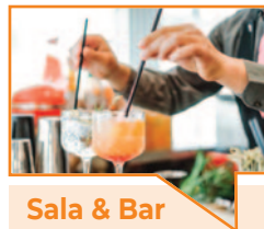
Sala & Bar